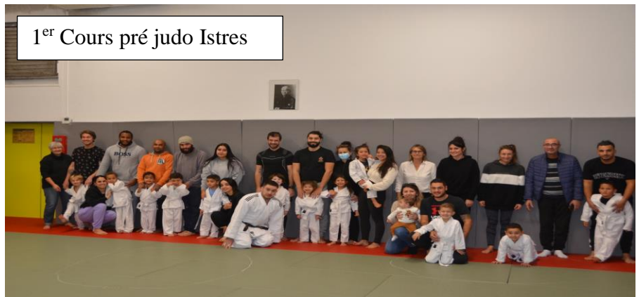
1 er Cours pré judo Istres

Toutes les photos sont sur le site du club