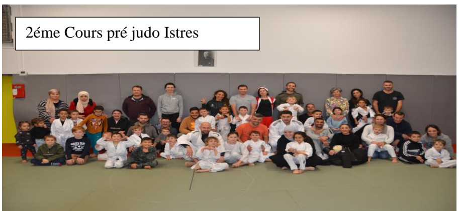
2éme Cours pré judo Istres

Toutes les photos sont sur le site du club